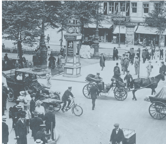
Bild: Eine Uhr für alle? Gut sichtbar scheint die Uhr den Takt der Großstadt vorzugeben, hier an der Kreuzung Friedrichstraße – Unter den Linden in Berlin, 1913