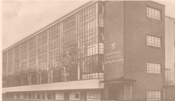
Bild: Walter Gropius (Architekt): Bauhausgebäude Dessau (1926) als Gauführerschule der NSDAP (1937), © Klassik Stiftung Weimar

In Kooperation mit der Klassik Stiftung Weimar.