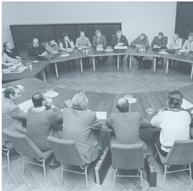
Bild: Treffen des Jenaer Runden Tisches aus Oberbürgermeister und »Vertretern von Parteien, Massenorganisationen und Bürgerbewegungen« am 1.12.1989

Veranstaltung in Kooperation mit der Gesellschaft zur Erforschung der Demokratie-Geschichte e.V.