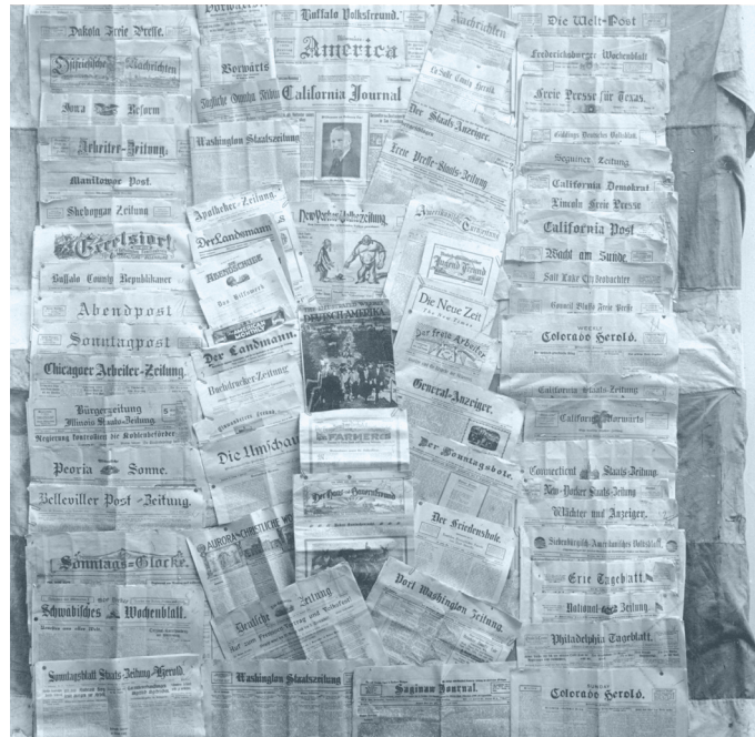
Bild: Stellwand mit deutschen Zeitungen in Nordamerika, März - September 1922