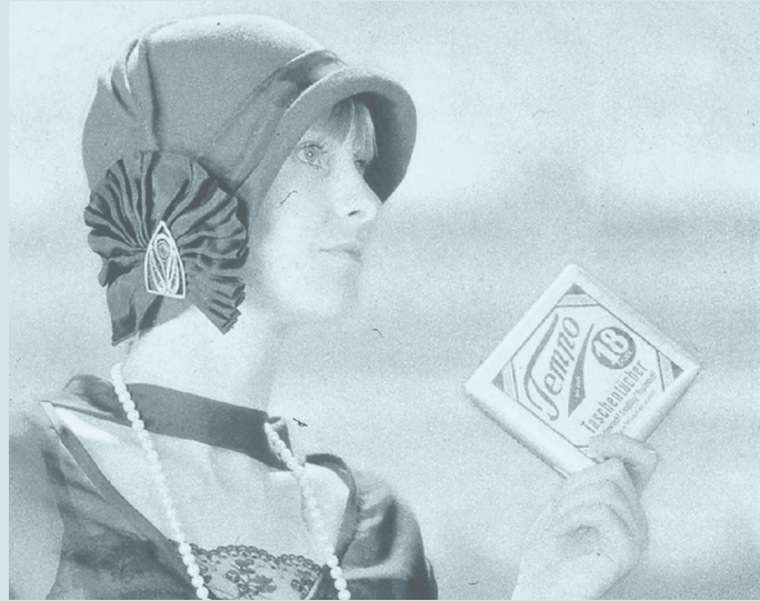
Bild: Am 29. Januar 1929 wird das Warenzeichen Tempo beim Reichspatentamt in Berlin angemeldet. Das erste deutsche Papiertaschentuch mit dem schwungvollen Namen entwickelt sich rasch zu einem Verkaufsschlager. Es ist seit 75 Jahren die führende Papiertaschentuchmarke auf dem deutschen Markt.