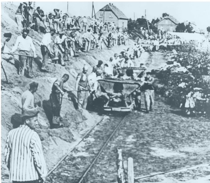
Bild: Ressource Mensch: Häftlinge des Konzentrationslagers Sachsenhausen bei harter körperlicher Arbeit in einem Klinker-Werk, ca. 1940

Stadtmuseum Weimar • 15:00 Uhr • Vortrag