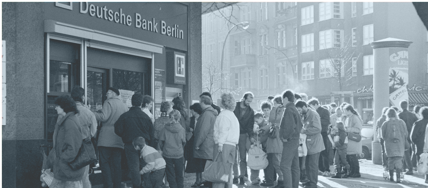
Bild: Bankfiliale in Berlin-Charlottenburg, in der sich im November 1989 DDR-Bürger ihr Begrüßungsgeld abholen (Bundesarchiv, B 145 Bild-00101558, Fotograf: Klaus Lehnartz)