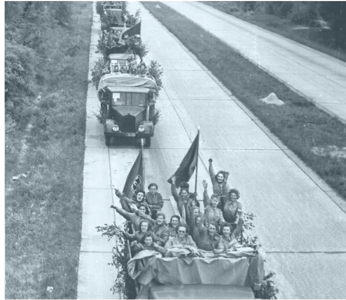
Bild: Vom 25. bis 29. Mai 1950 fand in Berlin das Deutschlandtreffen der Jugend statt, an dem 500.000 junge Friedenskämpfer und zahlreiche ausländische Gäste teilnahmen

Philosophen haben seit der Antike gefragt, wie die Zeithorizonte von Vergangenheit, Gegenwart und Zukunft zusammenhängen. Historiker können zumindest klären, wie sie im 20. Jahrhundert miteinander in Beziehung gesetzt wurden. Dies geschah auf sehr unterschiedliche Weise – die Weimarer Demokratie war von einer anderen Zeitordnung getragen als das »Dritte Reich«, beide unterschieden sich vom Zukunftspathos der DDR. Der Vortrag zeichnet nach, wie die »Zeit-Verhältnisse« von Vergangenheit und Zukunft nach dem Ende der Weimarer Republik in den beiden Diktaturen des 20. Jahrhunderts in Deutschland in den Dienst der Politik gestellt wurden. Deutlich wird dabei: »Zeit« wurde dort zu einer zentralen Ressource zur Legitimation