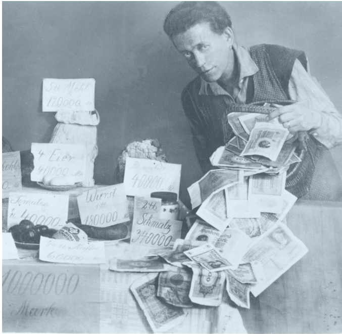
Bild: Wie wenig man sich für eine Million kaufen kann. Die Aufnahme stellt die ungeheuerlichen Preise für Lebensmittel dar