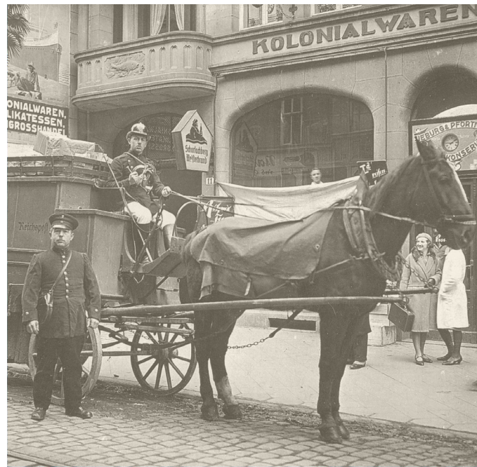
Bild: Auf zur letzten Fahrt der Gothaer Postkutsche 1931