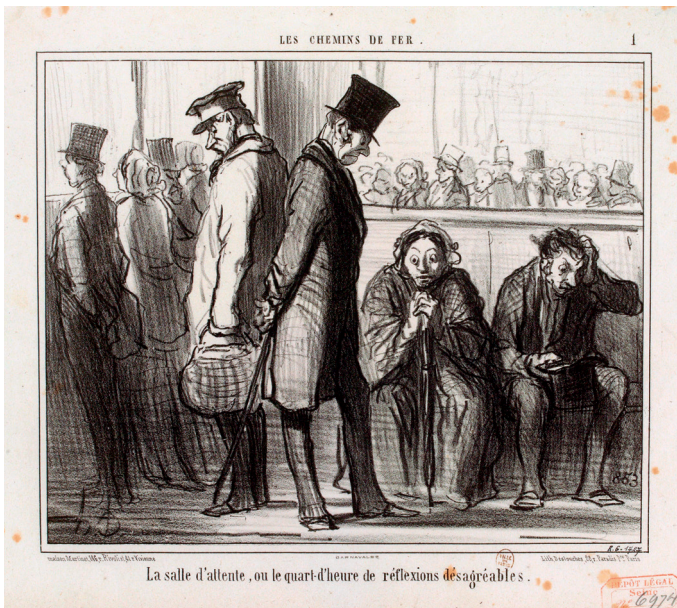
Honoré Daumier: Der Wartesaal oder die Viertelstunde der unangenehmen Reflexionen, Lithographie (um 1855), Musée Carnavalet, Paris