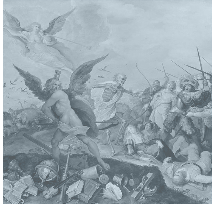
Bild: Frans Francken d. J., Der Kampf der Zeit gegen den Tod, um 1620 - 1630 (Ausschnitt)

Veranstaltung in Kooperation mit der RaumZeit-Forschung der Universität Erfurt.