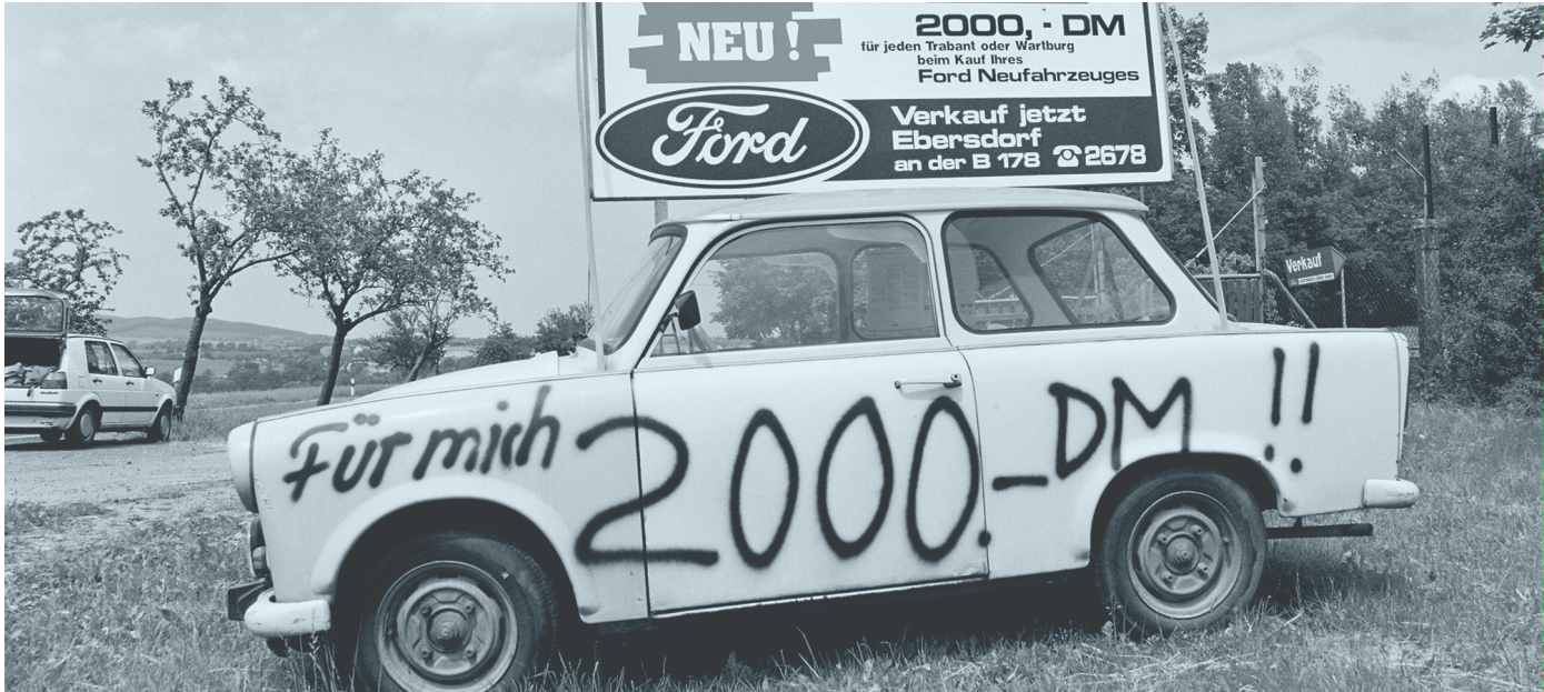
Bild: Abwrackprämie 1992: Trabi gegen West-Auto (Bundesarchiv, B 145 Bild-00111237, Fotograf: Engelbert Reineke)