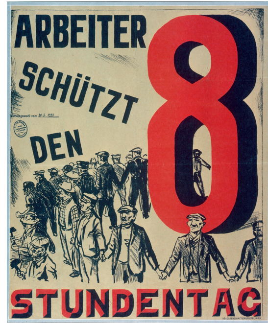
Bild: Plakat zur Reichstagswahl 1928. Der heutige Stand der regulären Arbeitszeit ist das Ergebnis langer sozialer und politischer Kämpfe